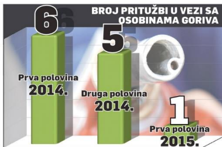
VRSTE PRITUŽBI ZBOG PROBLEMA NA BENZINSKIM PUMPAMA

Program markiranja država je pokrenula prvenstveno da bi se sprečilo izbegavanje plaćanja akcize i PDV-a na goriva. On se zasniva na tome da se sve gorivo koje legalno dolazi na tržište pri